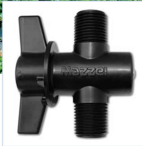
Polipropileno Resistente a UV